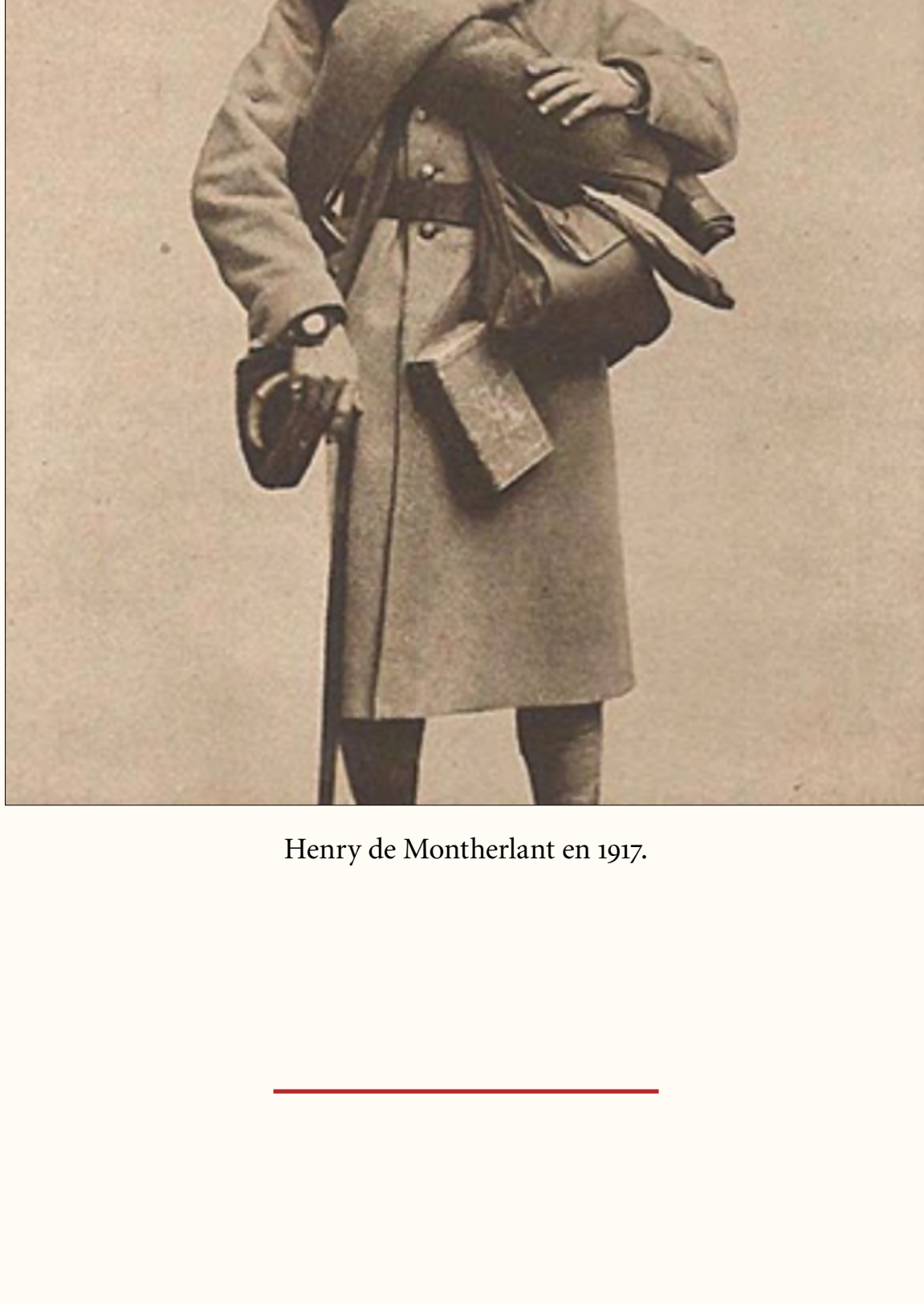
Henry de Montherlant en 1917.

Henry de Montherlant Oise, 1918, 360 e régiment d'infanterie